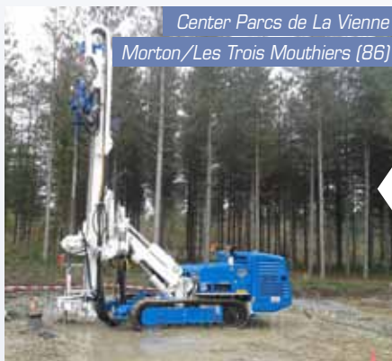
Center Parcs de La Vienne Morton/Les Trois Mouthiers (86)

Pour reprendre l'intégralité des charges des 850 cottages d'un centre de vacances sur un terrain argileux, réalisation de plus de 7 600 micropieux en 9 mois.