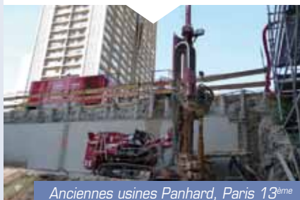
Anciennes usines Panhard, Paris 13 ème

Pour réaliser une fouille verticale sur un site en réhabilitation, une berlinoise auto-stable a permis de conforter les sols présentant de nombreuses contraintes (réseaux, carrières, voie ferrée...).