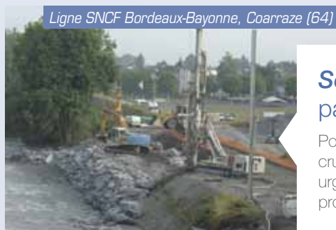
Ligne SNCF Bordeaux-Bayonne, Coarraze (64)

Reprise en sous-œuvre et création de fondations profondes par micropieux sur un ouvrage classé du 19 ème siècle en centre-ville. Utilisation d'un matériel de petit gabarit avec groupe hydraulique déporté pour un rapport poids/puissance optimal.