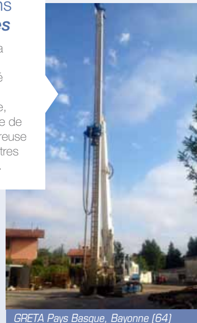
GRETA Pays Basque, Bayonne (64)

Pour assurer la portance d'un bâtiment dédié à la formation professionnelle, mise en oeuvre de pieux tarière creuse jusqu'à 28 mètres de profondeur.