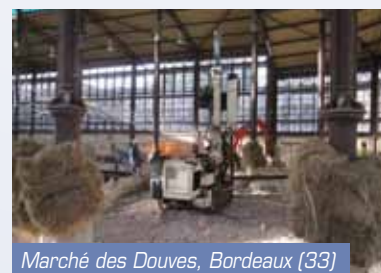
Marché des Douves, Bordeaux (33)

Pour sauvegarder l'intégrité de la voie ferrée après le basculement d'un pylône EDF, réalisation d'un soutènement de type «Arcachonnaise» par battage de profilés H et de plaques métalliques. Travaux d'urgence sous circulation ferroviaire.