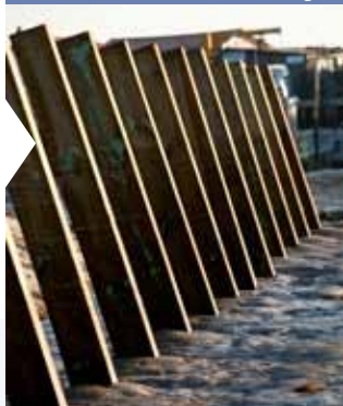
Port ostréicole de Pirailan, Lège Cap-Ferret (33)

Pour respecter les consignes des Bâtiments de France dans le cadre de la réfection d'un port, mise en oeuvre de pieux bois (ressource naturelle) avec parement bois et contre rideau tiranté dans le sol.