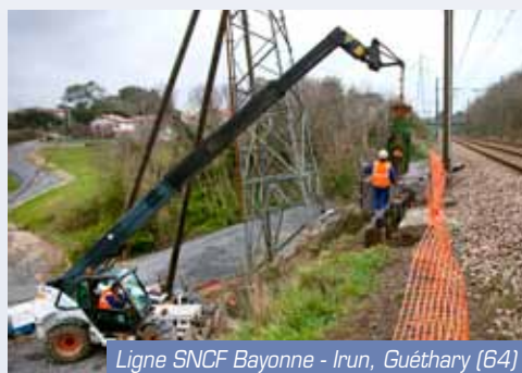
Ligne SNCF Bayonne - Irun, Guéthary (64)

Pour la reprise de l'ensemble des fondations d'un ouvrage classé, mise en oeuvre de pieux battus, opération réalisée à marée basse.