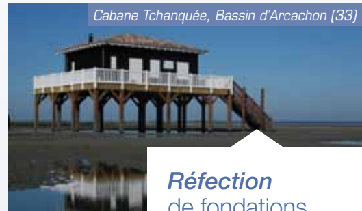
Cabane Tchanquée, Bassin d'Arcachon (33)

Pour créer trois ouvrages hydrauliques sous l'autoroute A65, réalisation de rideaux de palplanches.