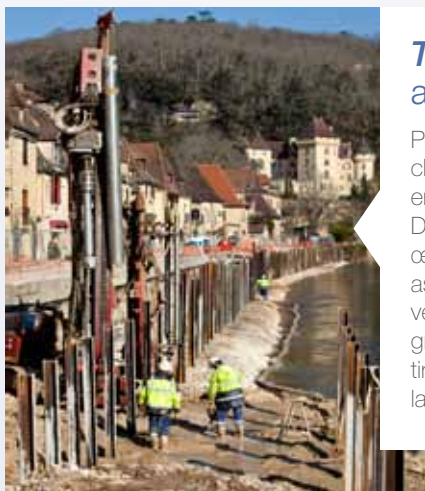
Traversée du bourg, La Roque Gageac (24)

Pour élargir la chaussée existante en prenant sur La Dordogne, mise en oeuvre d'une berlinoise associant des pieux verticaux forés de gros diamètres et des tirants actifs assurant la stabilité.