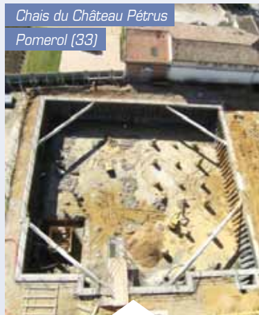
Chais du Château Pétrus Pomerol (33)